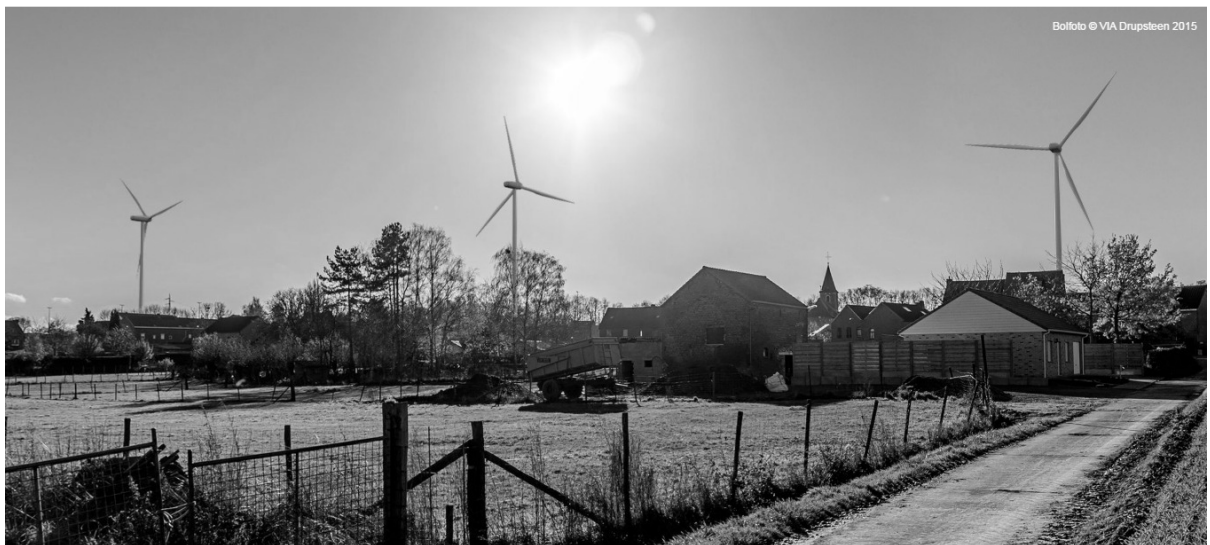
Bofoto © VIA Drupsteen 2015

Bovenstaande foto staat op de website van de projectontwikkelaars zelf, en geeft een realistische voorstelling, volgens het laatste plan, vanuit de Doelstraat. 3 windturbines overheersen het uitzicht en werpen hun slagschaduw over het volledige dorp.